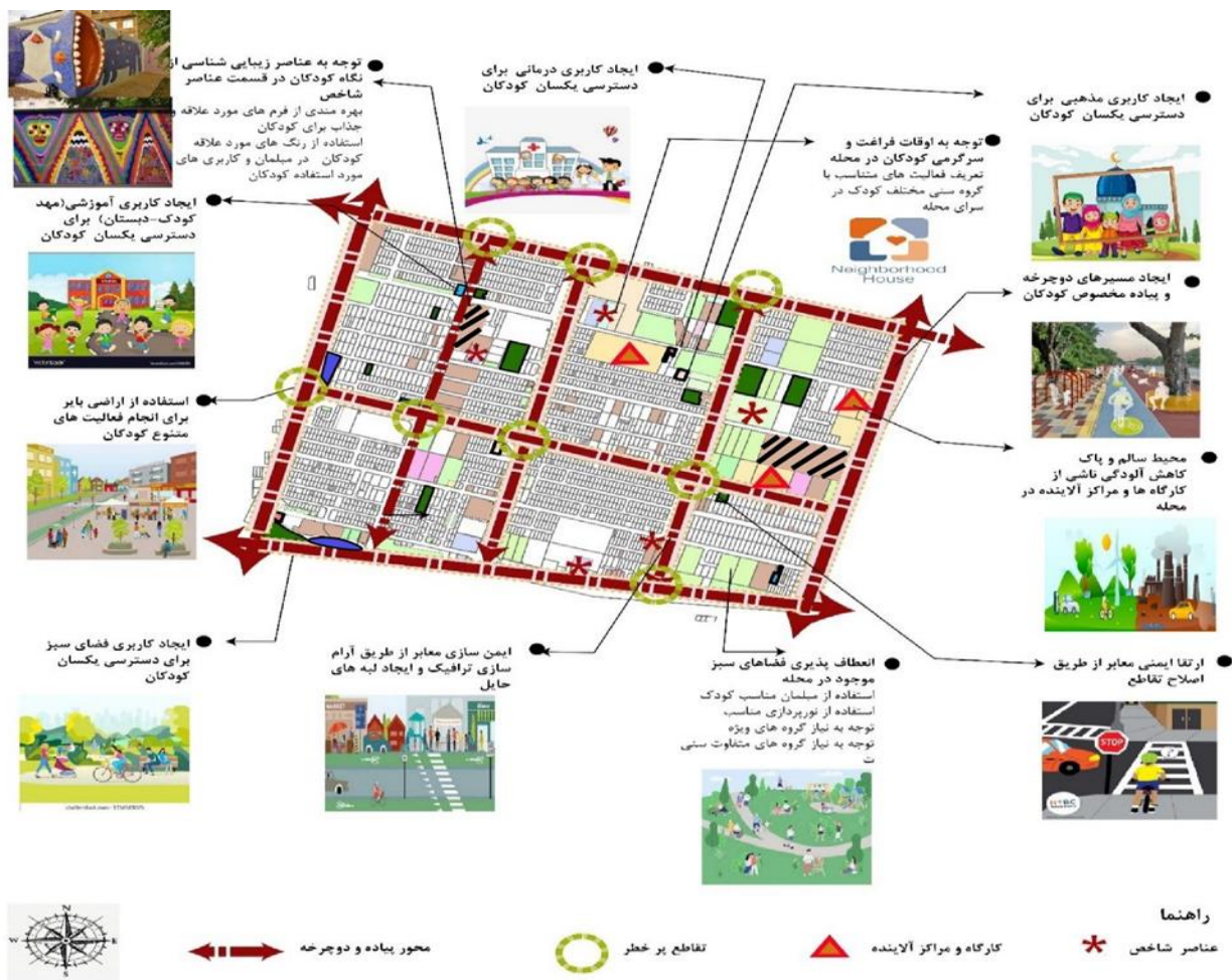
تصویر ۳ برنامه اقدام محله پونک جنوبی تهران