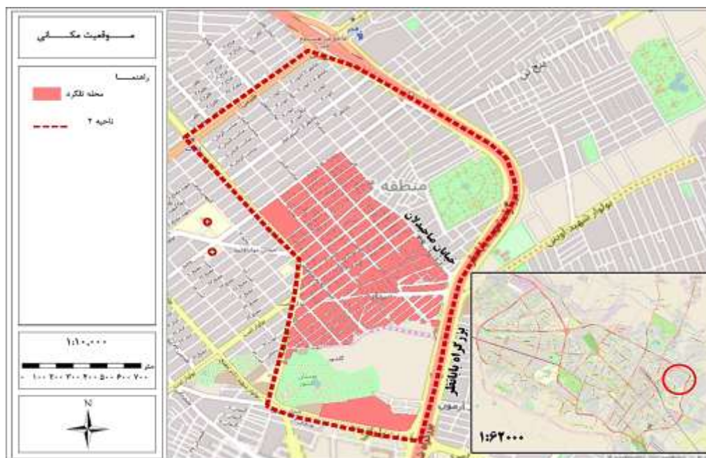
شکل ۱. موقعیت محدوده مورد مطالعه محله تلگرد