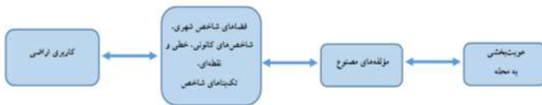
نمودار ۱. شاخص‌ها و متغیرهای تحقیق