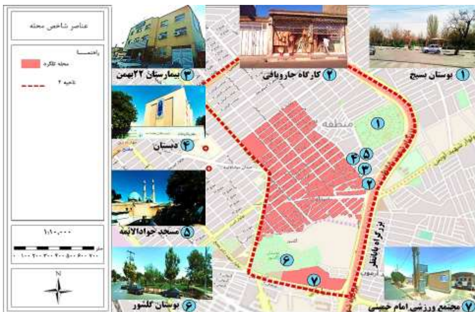
شکل ۳. عناصر شاخص محله تلگرد