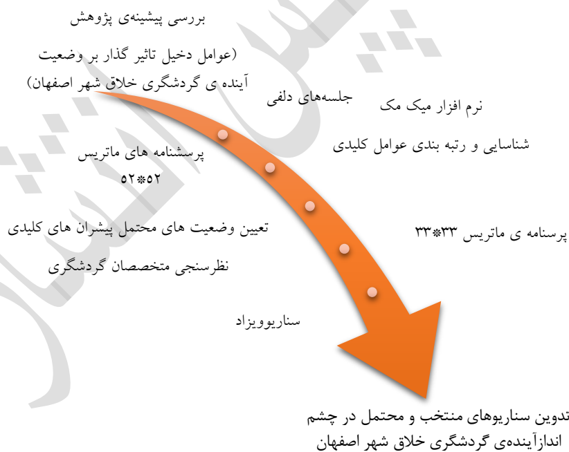
شکل (۱)، روش پژوهش.

است. عوامل به دست آمده، ویرایش و عوامل مشابه و عواملی که با یکدیگر هم پوشانی داشته‌اند حذف و تفکیک شدند. بعد یک ماتریس ۵۵ در ۵۵ تشکیل گردید. با استفاده از روش تاثیر متقابل که یکی از روش های نیمه کمی آینده پژوهی است طی پرسشنامه‌ای توسط خبرگان تکمیل شد. سپس با استفاده از نرم افزار میک مک، ارتباط متغیرهای دخیل در آینده‌ی گردشگری خلاق شهر اصفهان را مورد تحلیل قرار داده و نهایتاً "عوامل کلیدی جهت تبیین چشم انداز آینده‌ی گردشگری خلاق شهر اصفهان استخراج گردید. در مرحله بعدی برای هر یک از متغیرهای کلیدی آینده‌های محتمل تعریف شد. مجدداً طی پرسشنامه‌ای ماتریس ۳۳ در ۳۳ خدمت پانل خبرگان تکمیل و سپس جهت وزن دهی و رتبه بندی وارد نرم افزار سناریویزاد شد.