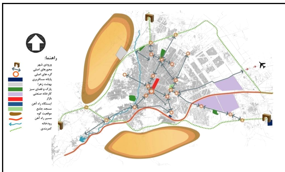
شکل ۲. سازمان فضایی شهر اراک