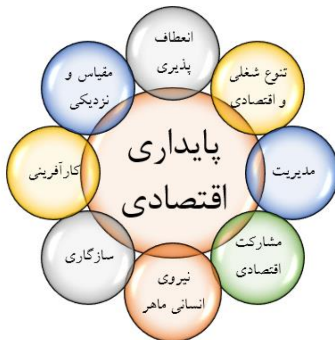
شکل ۱. ابعاد پایداری اقتصادی

مقیاس و نزدیکی: بسیاری از اقتصاددانان از صرفه‌های مقیاس به‌عنوان ملاک عملی برای تشخیص درجه رقابت یا انحصاری بودن بازارها استفاده می‌کنند (خداداد کاشی، ۱۳۸۶، ص. ۱). مشارکت اقتصادی: امروزه مشارکت به‌عنوان رهیافتی کارآمد، نقش مهمی در دستیابی به معیشت پایدار و برقراری نظام پایدار اقتصادی در جوامع ایفا می‌کند. در واقع رهیافت مشارکت با فراهم آوردن بستر همکاری و ایجاد جریان اطلاعاتی در بخش‌های مختلف تولید، خدمات و بازرگانی، زمینه مناسبی را جهت استمرار و پایداری نظام اقتصاد جوامع به‌وجود می‌آورد (شایان و همکاران: ۱۳۹۱، ص. ۹۵). تغییر و تحول (انعطاف‌پذیری): در پایان قرن بیستم تولید انعطاف‌پذیر جای خود را به تولید انبوه داده است. در عصر کنونی با تغییر شیوه‌های تولید، چهره زندگی دگرگون خواهد شد. تولید انعطاف‌پذیر فلسفه‌ای متفاوت دارد که در آن رابطه بین قیمت، تعداد، کیفیت و سود برقرار می‌گردد که با تفکرات گذشته متفاوت است. گفته می‌شود مشکل کمبود زمین یکی از دلایل شکل‌گیری سیستم تولید انعطاف‌پذیر است. توانایی خلق مزیت نسبی و رقابتی در محیط پویا و پر تحول صنعت امروزی یک ارزش است. تولید انعطاف‌پذیر سیاست نسبتاً جدیدی است که توسط شرکت‌های موفق برای توسعه و افزایش رقابت به کار گرفته می‌شود (فرهمند و همکاران، ۱۳۹۳، ص. ۴).