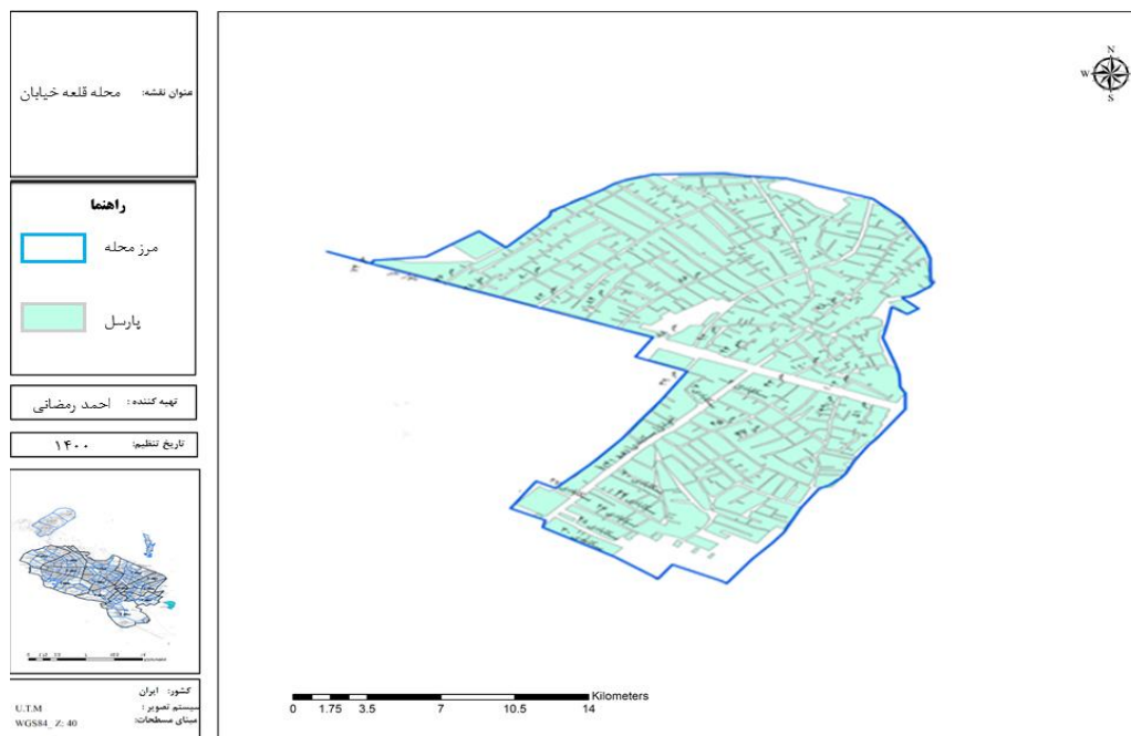
شکل ۱. نقشه محدوده مورد بررسی در کلان‌شهر مشهد

جامعه آماری پژوهش حاضر، محله «قلعه خیابان» یا «شهرک شهید باهنر» به‌عنوان یکی از مهم‌ترین محلات حاشیه‌نشین در شهر مشهد بود. در سرشماری‌های عمومی نفوس و مسکن مرکز آمار ایران تا سال ۱۳۸۵، این شهرک به نام روستای «قلعه خیابان» به‌عنوان زیرمجموعه دهستان میامی از بخش رضویه شهرستان مشهد شناخته شده است، اما این شهرک از تیرماه ۱۳۸۹ به محدوده شهری افزوده شد و از خدمات شهرداری برخوردار شد. این محله با تراکم نسبی ۲۷۴ نفر در هر هکتار، در حاشیه شهر مشهد واقع شده است. از ویژگی‌های فرهنگی و اجتماعی این محله می‌توان به وجود مشکلات کالبدی، مشکلات امکانات شهری، مشاغل غیررسمی، آسیب‌های اجتماعی، بافت قومیتی (متشکل از اقوام فارس، بلوچ، افغان و چلو)، بی‌هویتی، اعتیاد و تنوع مذاهب (شیعه و سنی) اشاره کرد (شریفی پستیچی، جوان، شایان و رهنما، ۱۳۹۴، ص. ۹).