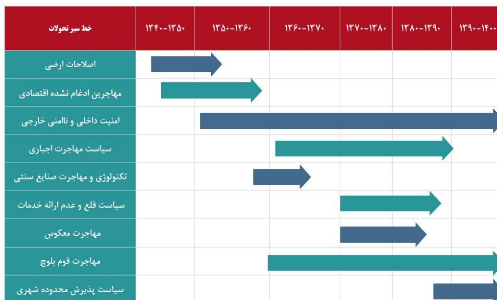
شکل ۲. خط سیر تحولات مؤثر بر پیدایش قلعه خیابان

شده است، بلکه فرایند تحولات و خط سیر تاثیرات آن در دهه‌های آتی همچنان وجود دارد؛ در ادامه این تحولات و عوامل مؤثر بر آن‌ها به صورت تحلیلی مورد بررسی قرار می‌گیرد.