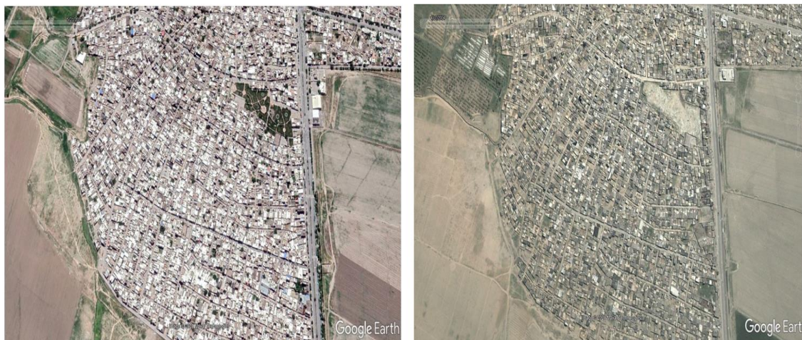
شکل ۳. عکس هوایی از قلعه‌خیابان در سال ۱۳۸۸ شکل ۴. عکس هوایی از قلعه‌خیابان در سال ۱۴۰۰

بازتولید حاشیه و افزایش جمعیت خواهد شد و مشکلاتی را برای حاشیه‌نشینان ایجاد می‌کند. مرور داده‌های جمعیتی و پژوهشی محله قلعه‌خیابان و تصاویر زیر ناکارآمدی این سیاست‌ها را در این محله حاشیه‌ای نشان می‌دهد.