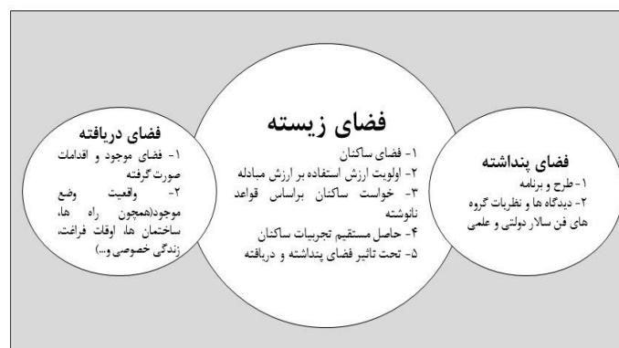
شکل ۲. سه لحظه‌ی فضایی در بررسی سکونتگاه‌های خودانگیخته‌ی شهری

اصلی بین‌الملل، ملی و محلی به صورت پیوستار مورد بررسی قرار گیرد. در این راستا در چارچوب نظریه تولید فضای هانری لوفور و سه وجه فضایی مطرح‌شده توسط وی به صورت دیدگاهی یکتا از فضا، مسئله زیست‌غیررسمی شهری مورد بررسی قرار گرفت؛ چراکه در نتیجه‌ی چنین دیدگاهی، نفوذ به لایه‌های زیرین واقعیت امکان‌پذیر است و این نیز خود به واسطه‌ی نوعی اندیشه‌ورزی ممکن است که صرفاً دربند پدیدارها و نمودهای مسئله نماند، بلکه بتواند با ژرفکاوای لایه‌های زیرین پدیدارها را بشکافد و سازوکارها، نیروها و گرایش‌های ساختاری یک مسئله را شناسایی، تبیین و مفهوم‌پردازی کند. یک مفهوم‌پردازی واقعی، نمی‌تواند صرفاً به نتایج، پیامدها، نمودها و امور جزئی محدود بماند بلکه مهم‌تر از آن، باید بتواند پیوند این امور جزئی را با امور کلی‌تر شرح دهد و برهم‌کنش میان آن‌ها را تصویر کند. پس از بررسی مبانی نظری پژوهش با استخراج نحوه ارزیابی سه وجه تولید فضای غیررسمی و دید به سه سطح بین‌الملل، ملی و محلی، وضعیت تولید فضای