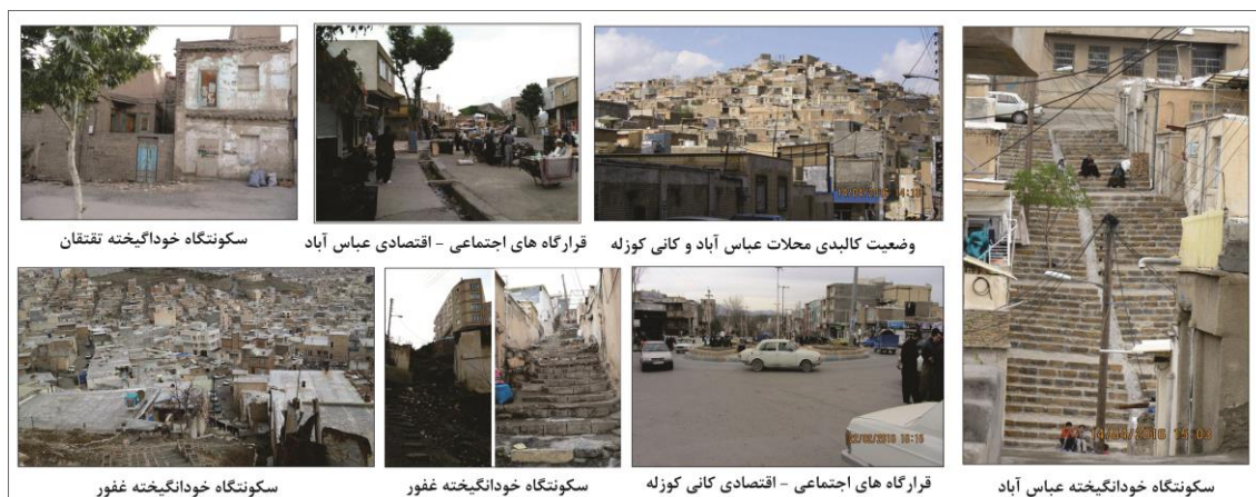
شکل ۵. وضعیت زیسته ساکنان در لایه اول فضایی سکونتگاه‌های خودانگیخته شهری سنندج

پایین توان تأمین هزینه‌ها در چارچوب قوانین و مقررات نبوده و نه تنها از شرایط و دیدگاه‌های انگل-وار به این ساکنان برخوردار نیستند بلکه وضعیت اجتماعی مناسبی در آن حکم فرماست.