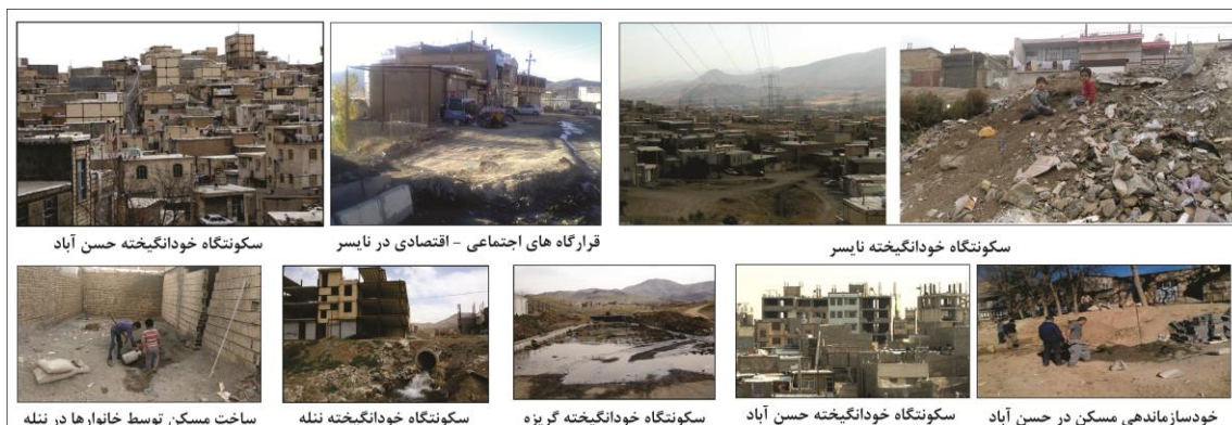
شکل ۶. لایه دوم فضایی سکونتگاه‌های خودانگیخته شهر سنندج

کردیم. "من ۱۵ سال است که در شهر سنندج زندگی می‌کنم. در سال ۱۳۸۱ همراه با پدرم از روستاهای اطراف شهر دهگلان به سنندج آمدم. پیش از ما خانوادگی عمو نیز به سنندج آمده بود؛ آن‌ها به ما اطلاع دادند که زندگی در گریزه بسیار راحت و ساخت و ساز نیز در آن با هزینه پایینی صورت خواهد گرفت. به این دلیل ما زمین‌های خود را در روستا فروختیم و به سنندج آمدم و در گریزه زمینی به صورت قولنامه‌ای خریدیم.