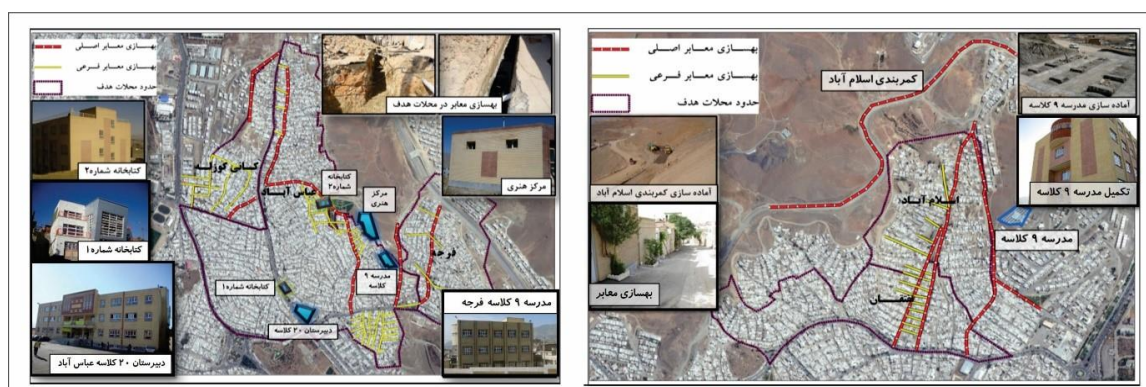
شکل ۴. محل پروژه‌های اجرا شده توسط بانک جهانی با همکاری شرکت عمران و بهسازی شهری (در لایه فضایی اول سکونتگاه‌های خودانگیخته شهری شهر سنندج)