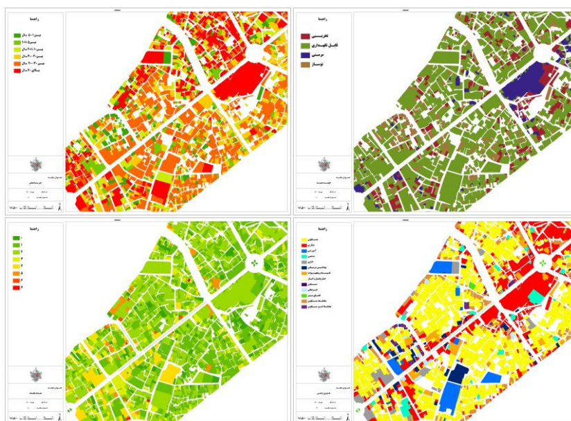
شکل ۱. نقشه محدوده مورد مطالعه