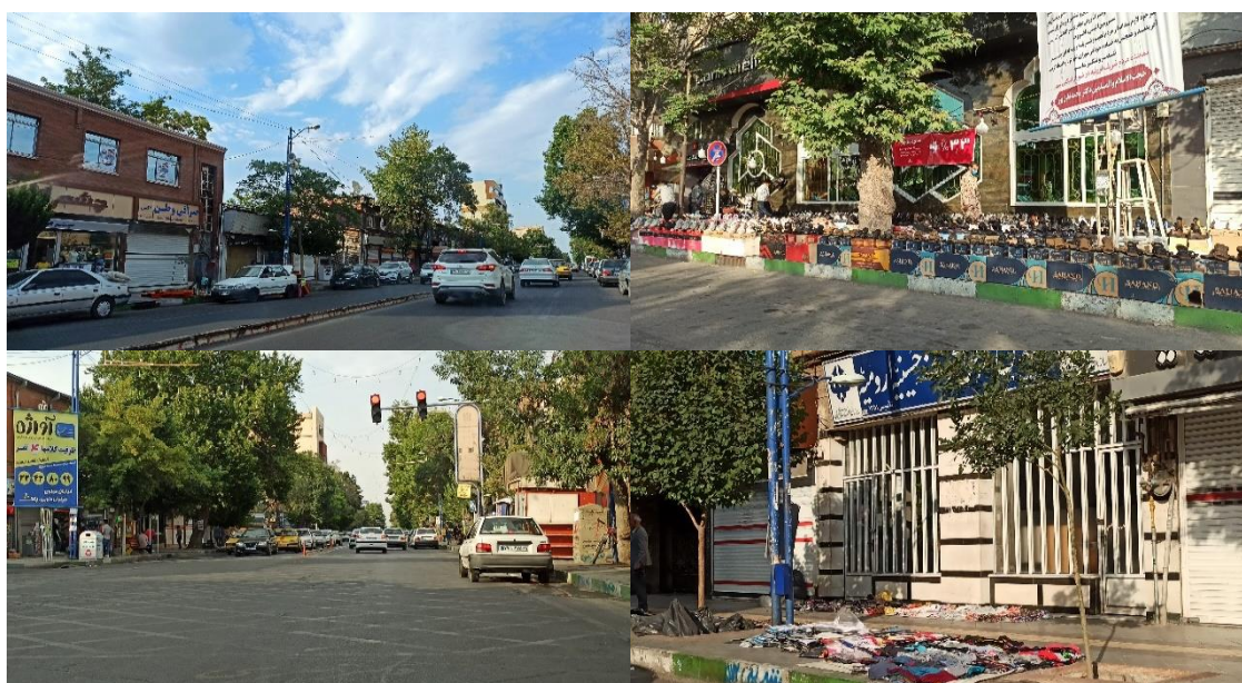
شکل ۲. وضع موجود محدوده مورد مطالعه