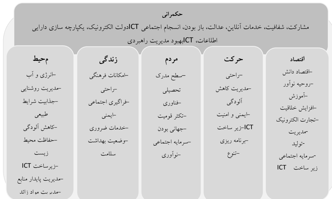
شکل ۱. ابعاد و معیار شهر هوشمند

رقابت‌های اقتصادی شهر هوشمند می‌شوند (کلداهی و همکاران، ۲۰۱۳، ص. ۲۲).