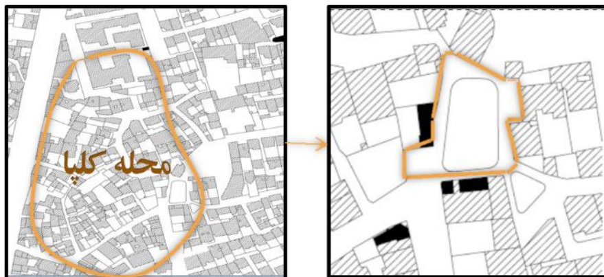
شکل ۲. موقعیت محله گلپا نسبت به عناصر همجوار و مسیرهای ورودی به مرکز محله