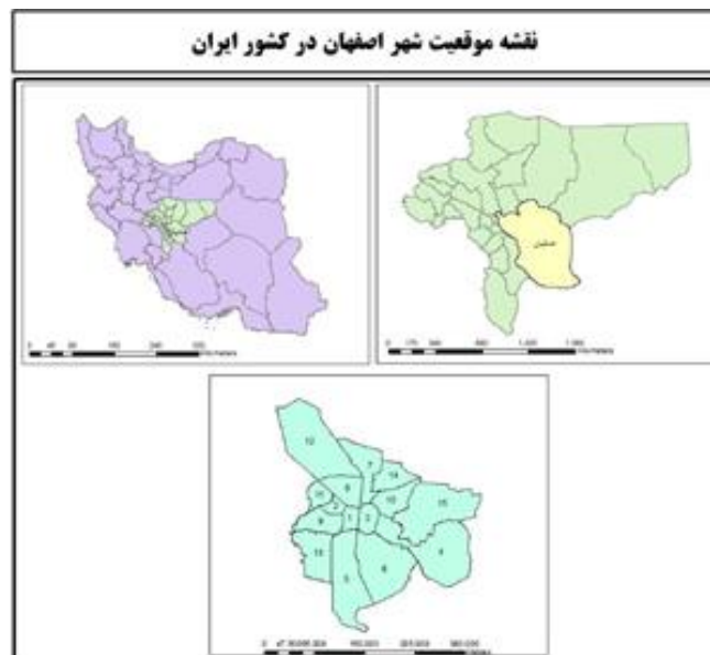
شکل ۱. موقعیت مناطق شهر اصفهان

محدوده مورد مطالعه، کلانشهر اصفهان است که با جمعیت ۱۹۶۱۲۶۰ (صابری و دانشور، ۱۳۹۸، ص. ۸۷) به عنوان سومین کلانشهر کشور در قلب ایران واقع شده است. این شهر در جایگاه حساس و مهمی در سلسله مراتب شهری ایران قرار دارد. محدوده شهری اصفهان طبق سالنامه آماری شهر اصفهان (سال ۱۳۹۵) دارای ۱۵ منطقه شهری (تقوایی و علی اکبری، ۱۳۹۷، ص. ۱۴۵) و شامل ۱۹۹ محله می‌باشد (تقوایی و همکاران، ۱۳۹۸، ص. ۲۴). این کلانشهر در خارج از محدوده شهری از غرب به خمینی شهر و نجف آباد، از جنوب به کوه صفه و سپاهان شهر، از شمال به شاهین شهر و از سمت شرق نیز به منطقه بیابانی ختم شده است (تقوایی و همکاران، ۱۳۹۹، ص. ۸).