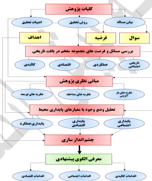
شکل ۱: مدل مفهومی پژوهش

بخش دیگر به سنجش نظر مدیران در ارتباط با نقش ها و عملکردهایی که این آثار می تواند به خود بگیرد پرداخت تا بتوان به بررسی پذیرش نقش این آثار در محرک توسعه پرداخت. بنابراین تعداد ۳۰ پرسشنامه از سه نهاد استانداری خراسان شمالی، سازمان مدیریت و برنامه ریزی استان و شهرداری بجنورد و به شکل طبقه بندی شده از سطوح مدیریتی توسط مدیران تکمیل شد. در مرحله نخست، شرایط و اطلاعات موجود مورد بررسی و تحقیق قرار گرفت و با استفاده از نتایج بدست آمده از مطالعات اسنادی، برداشت های میدانی و نتایج پرسشنامه ها، با تکنیک سوات، نقاط، ضعف، قوت، فرصت ها و تهدیدهای پیش رو شناسایی شدند. با تحلیل جدول SWOT به شناسایی راهبردها با قالب رویکرد بازآفرینی شهری و اولویت راهبردها با امتیاز دهی با روش QSPM پرداخته شد و سپس اقدامات اجرایی در سه قالب مدیریتی، اجتماعی و کالبدی برای احیاء مجموعه مفخم در راستای تحریک توسعه تعریف شد. در تصویر شماره یک مدل مفهومی پژوهش معرفی می گردد.