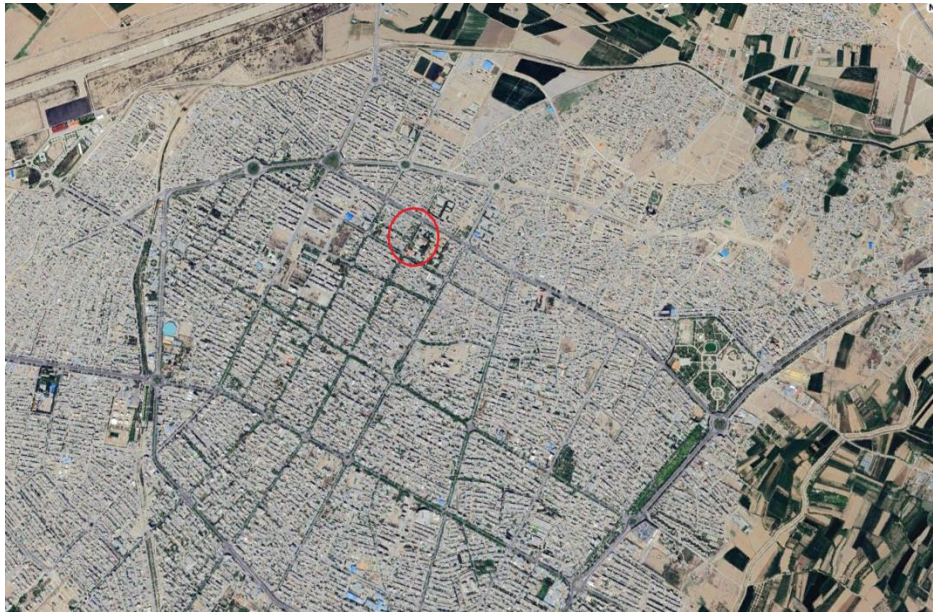
شکل ۳: موقعیت مجموعه تاریخی مفخم در شهر بجنورد