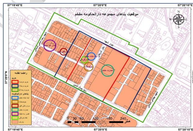
شکل ۴: موقعیت کروکی جانمایی بناهای مجموعه تاریخی دارالحکومه مفخم

عمارت و آیین خانه مفخم در حقیقت تک بناهای تاریخی نبوده بلکه عناصری از مجموعه حکومتی بوده اند. بنای تاریخی عمارت دارالحکومه مفخم به عنوان بزرگترین و شاخص ترین اثر معماری دوره قاجار است که در شمال شرق شهر بجنورد واقع می باشد. بنای معروف آیین خانه با بناهای دیگری از جمله عمارت مفخم، عمارت کلاه فرنگی و حوضخانه، در باغ بزرگی قرار داشته که آنها مجموعه دارالحکومه مفخم را تشکیل می داده اند. این بنا در دهه ۱۲۵۰ خورشیدی همزمان با دوره حکومت ناصرالدین شاه ساخته شده و به عنوان فضای اداری و دیوانی برای انجام دیدارهای رسمی و نیز انجام مراسم تشریفات نظامی، مورد استفاده قرار می گرفته است. متأسفانه عمارت کلاه فرنگی، حوضخانه بر اثر وقوع زلزله شدید، به طور کامل نابود شده و در حال حاضر تنها آیین خانه و عمارت مفخم به جای مانده است.